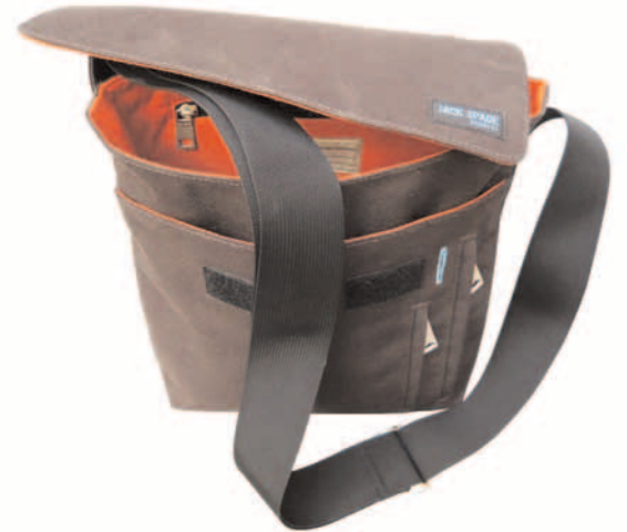
Kulttasche aus New York aus schokobraunem Canvas von Jack Spade @ Steinhauer