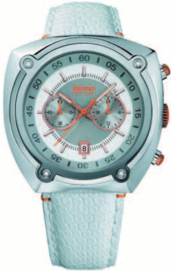
Sportliche Uhr mit Stahlgehäuse und Lederband @ Boss Orange