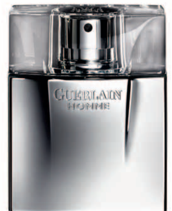
Eau de Toilette Guerlain Homme @ Guerlain