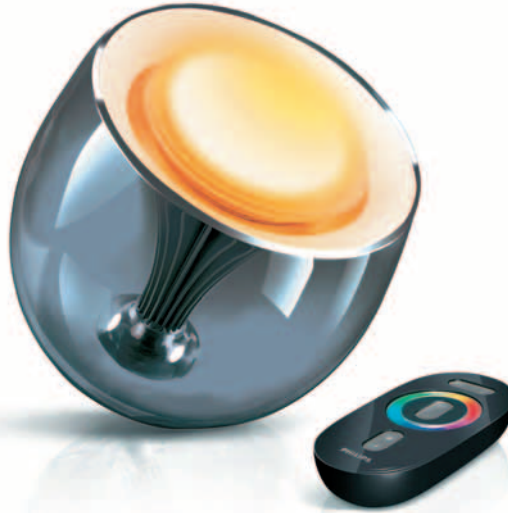
LED-Leuchte aus der Serie Living Colors mit über 16 Millionen Farbtönen für schöne Stimmungen Zuhause @ Philips