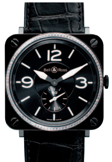
Uhr «BRS Black Ceramic&Diamonds» mit Alligatorenleder-Armband @ Bell & Ross