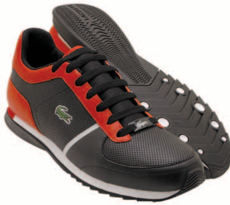
Freizeitschuhe aus der Retro-Kollektion mit Farbdetails @ Lacoste